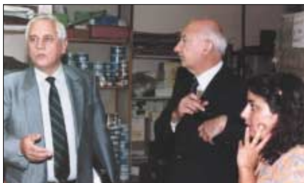
Il ministro degli Affari sociali, prof. Adriano Bompiani, visita le sedi di Cooperate

La Cooperate gestisce attualmente un'ampia rete di corsi 4 e servizi 5 dislocati nelle regioni Lazio e Puglia, sia in modo autonomo sia in partenariato con altri Enti.