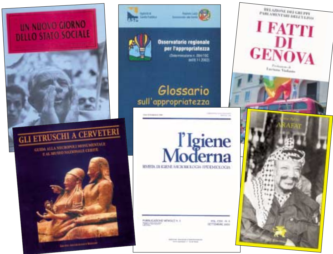
Pubblicazioni stampate nella tipografia del Centro di formazione “Giancarlo Brasca”.