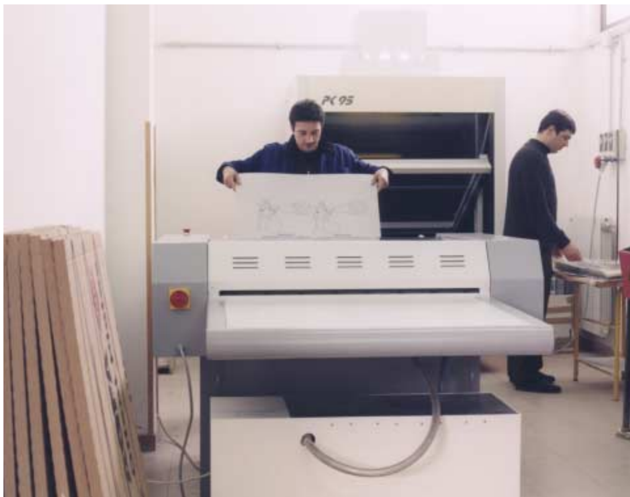
Incisione lastre fotosensibili.

Sacro Cuore, volle affidare la stampa della prestigiosa rivista Medicina e Morale al Centro di Formazione "Giancarlo Brasca". Testata che i medici cattolici di To-