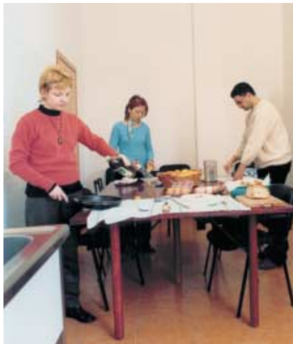
Preparazione del pranzo.

Il servizio è attivo ormai da quattro anni e si andato sempre più trasformando da centro a bassa soglia a vero e proprio centro semiresidenziale di attività rivolte anche ad alcoolisti e a situazioni di emarginazione sociale.