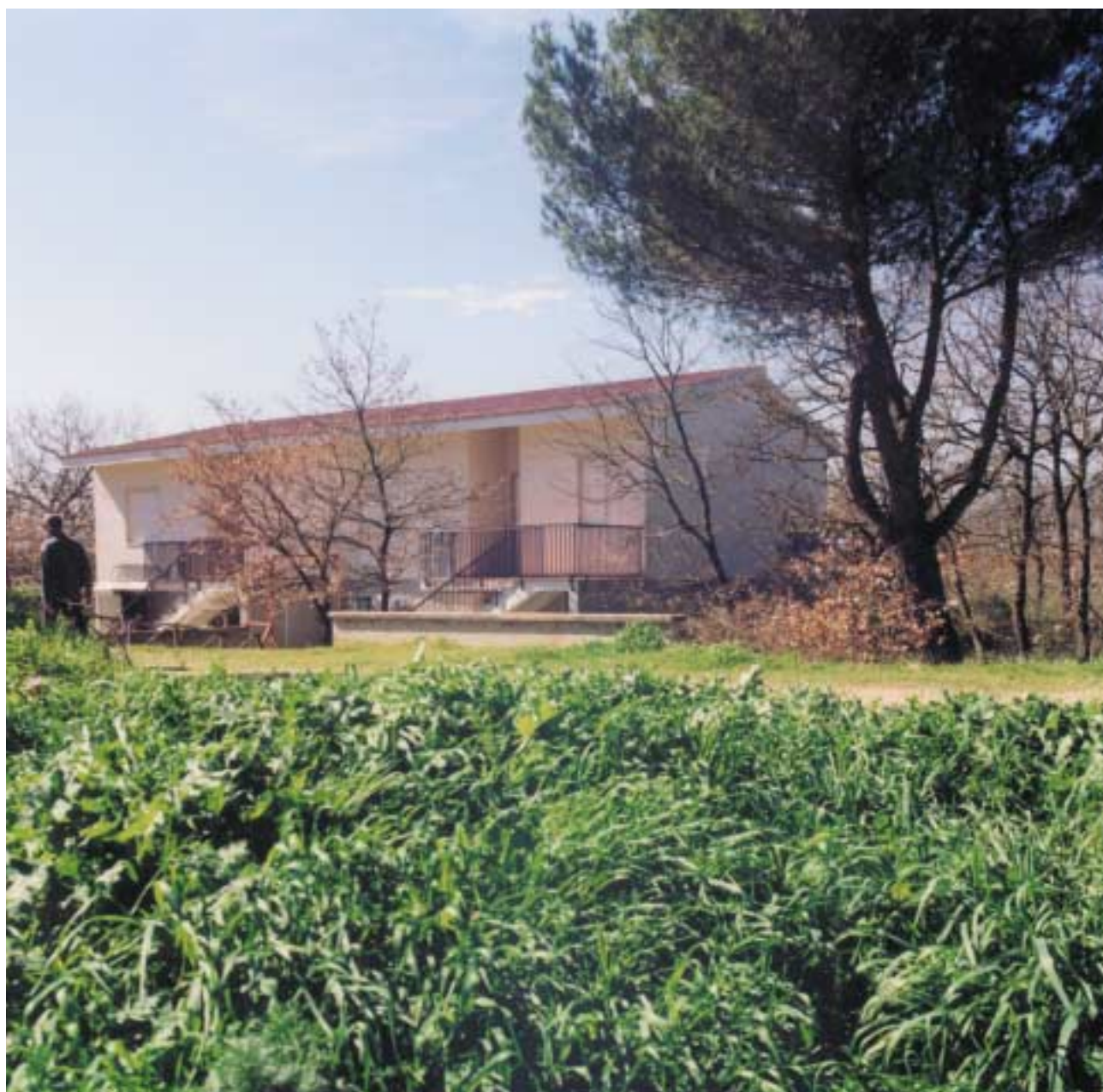
Edificio adibito ad attività ergoterapiche.