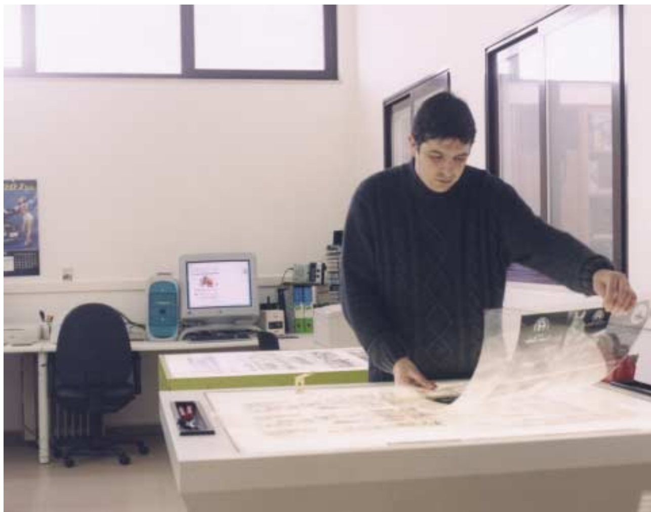
Controllo qualità nella pre stampa.