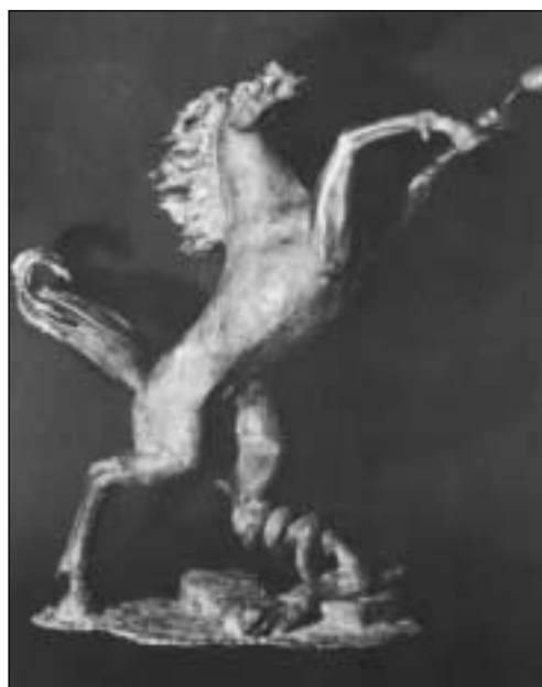
Cavallo che uccide un serpente - bronzetto 50x60 (Assen Peikov)