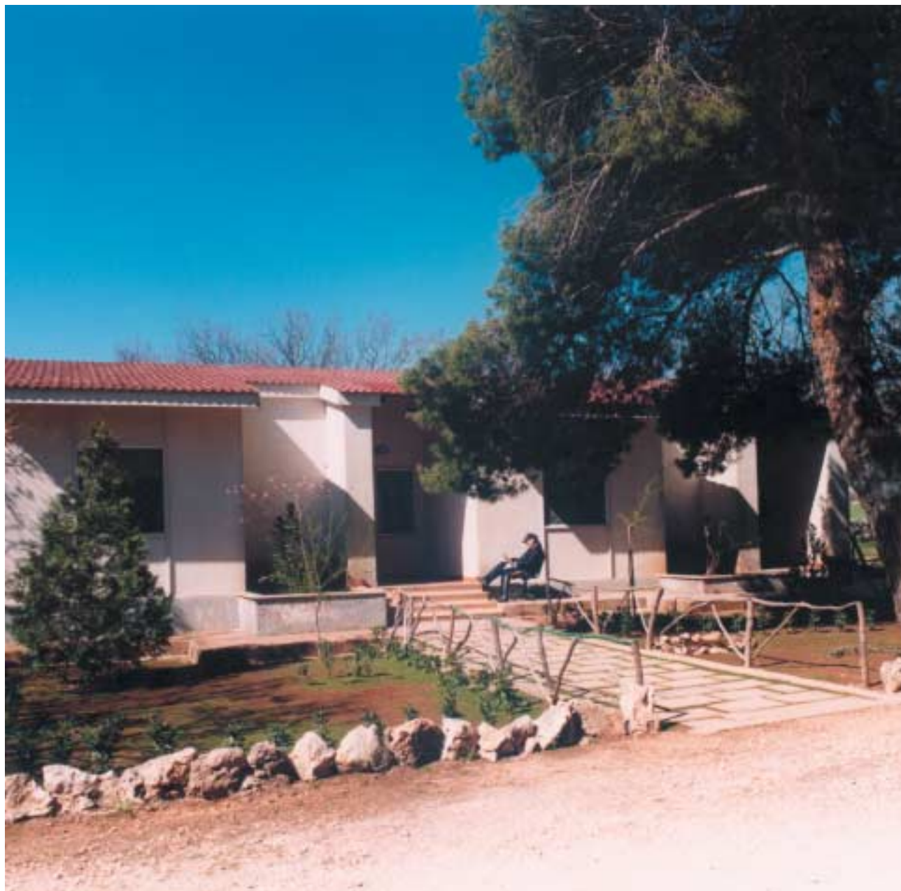
Una delle nove residenze bifamiliari.