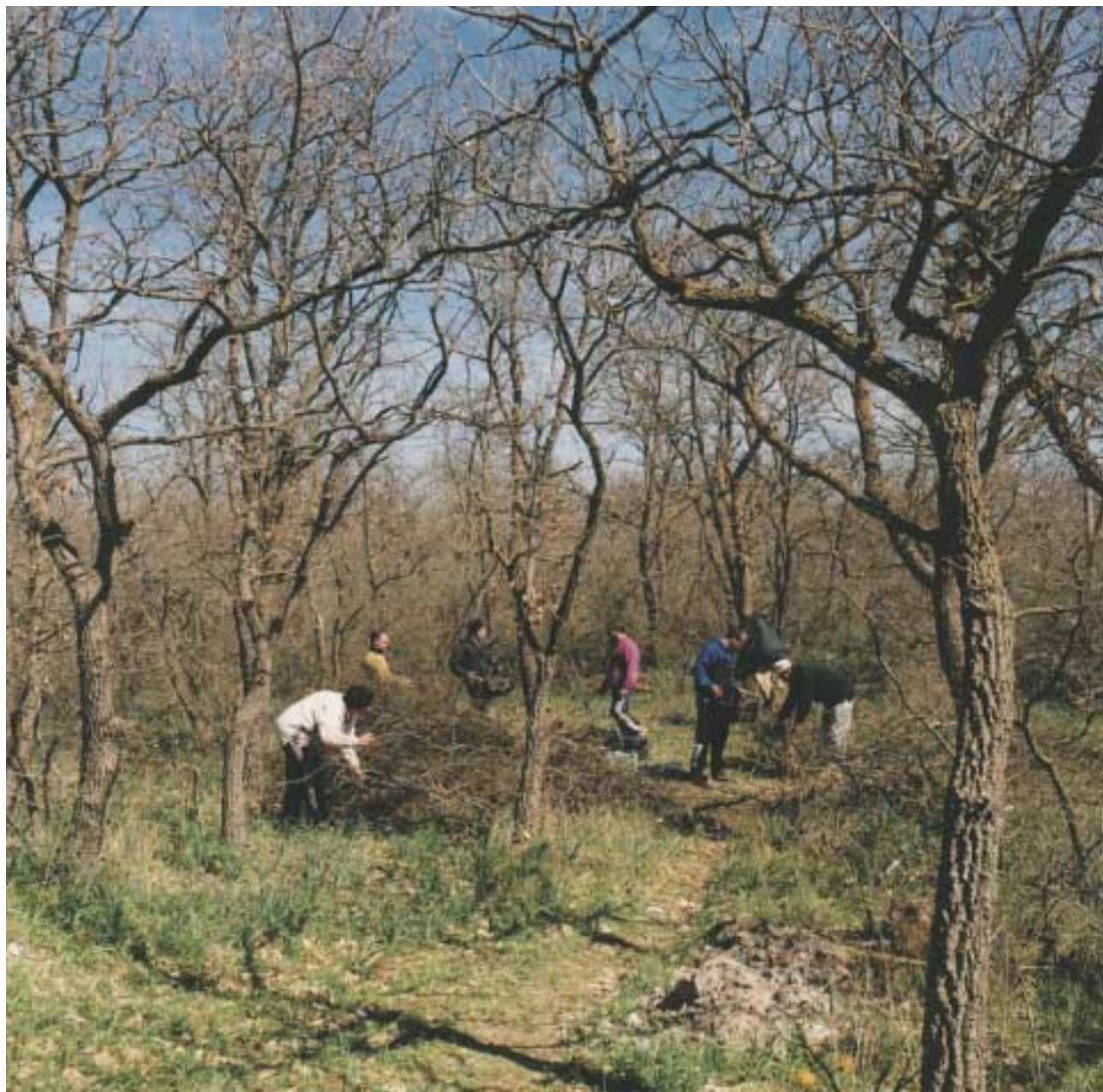
L'attività nella zona boschiva.