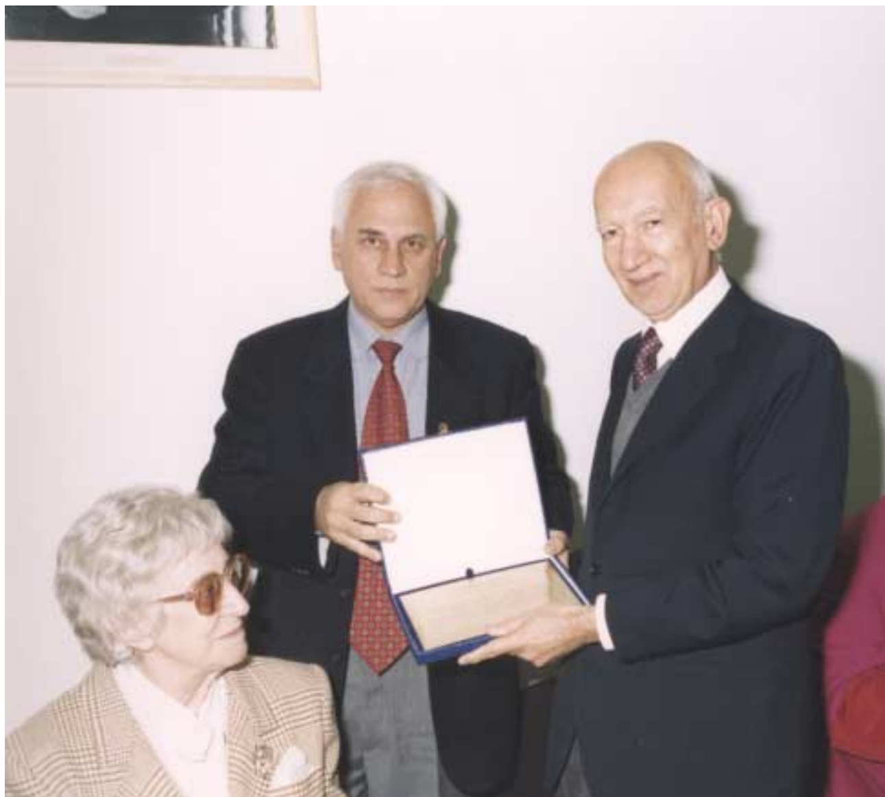
Targa ricordo al senatore Adriano Bompiani.