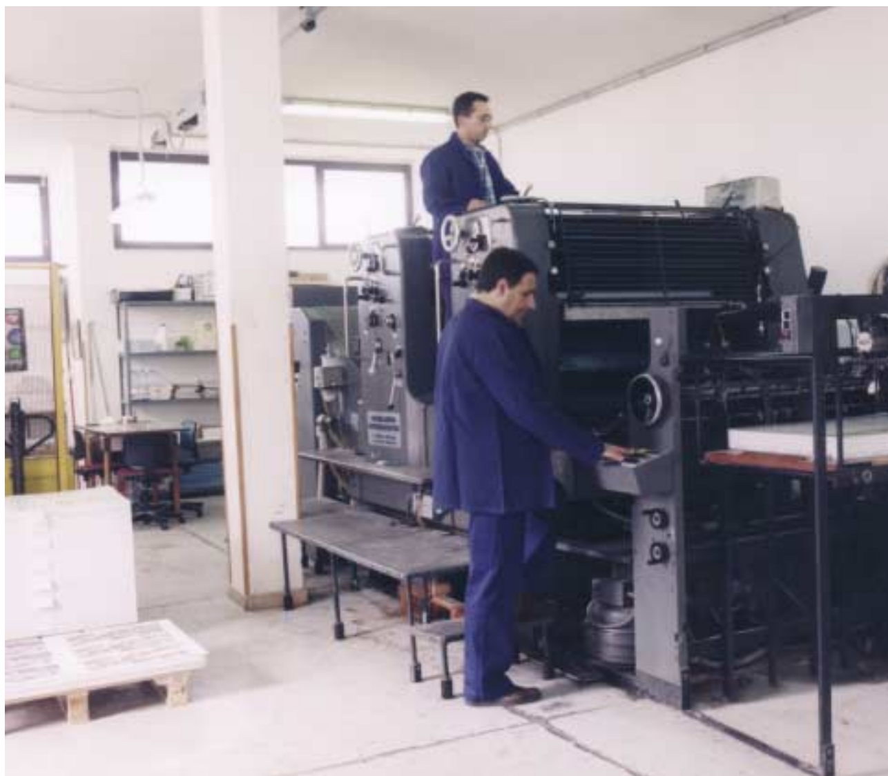
Stampa offset su macchine Heidelberg Speedmaster.