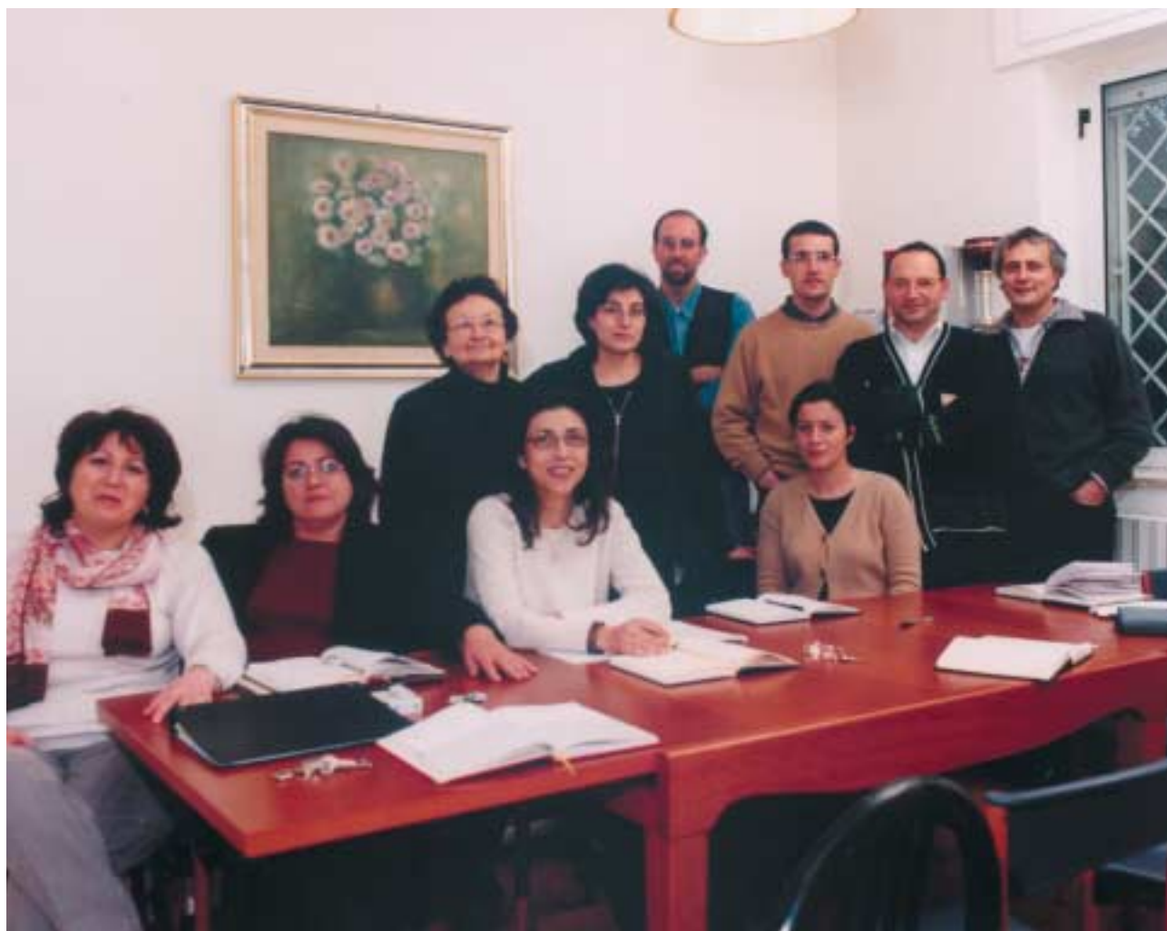
Gli operatori della sede di Gioia del Colle.

coglienza ed orientamento. All'origine dell'iniziativa fu la ricerca effettuata, in collaborazione con l'AITAED, sui primi dodici anni di funzionamento della Co-