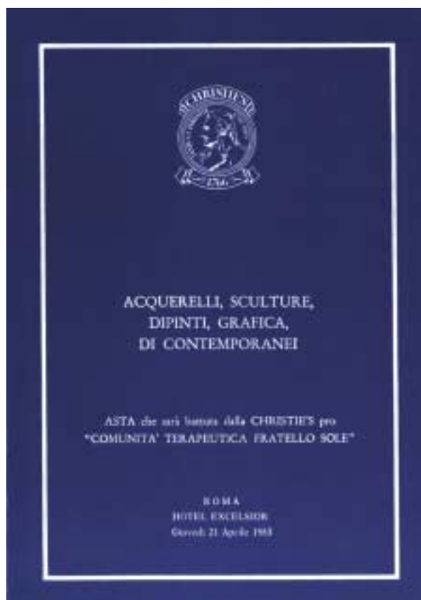
Il catalogo dell'asta CHRISTIE'S

prattutto ai locali messi a disposizione dall'"Opera Don Guanella", ubicati in Santa Severa, nelle immediate vicinanze di Roma.