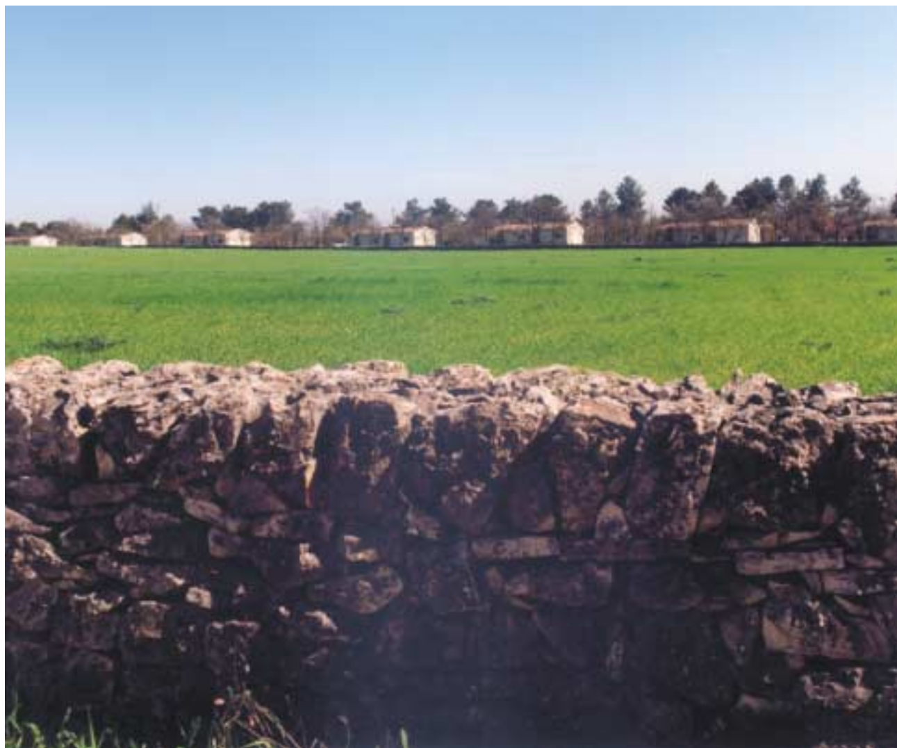
Vista del comprensorio.