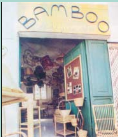
Santa Marinella. Il negozio per la vendita degli oggetti in bamboo prodotti dagli ospiti della comunità.

La nuova sede operativa "Giancarlo Brasca" sarebbe stata costruita su un terreno già acquistato dalla Cooperate in località Tolfa (Roma).