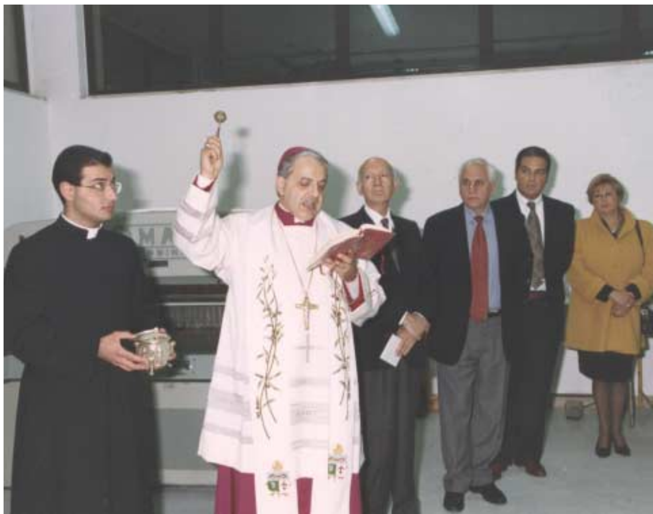
Il rito della benedizione.

dale Pediatrico Bambino Gesù e già Ministro per la Famiglia e la Solidarietà