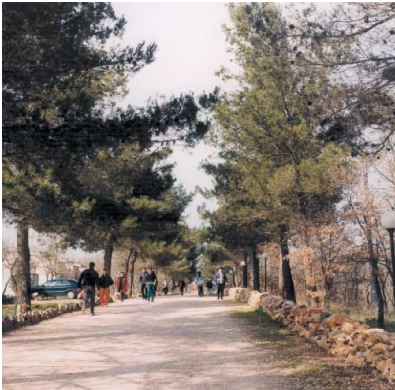
Viale interno della comunità.