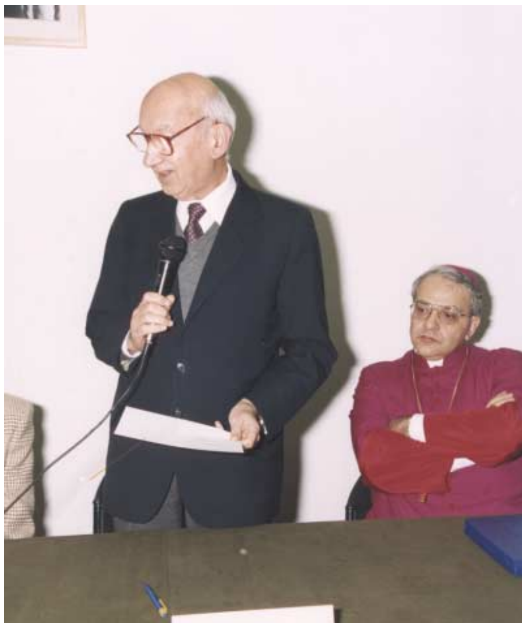
L'intervento del senatore Adriano Bompiani.