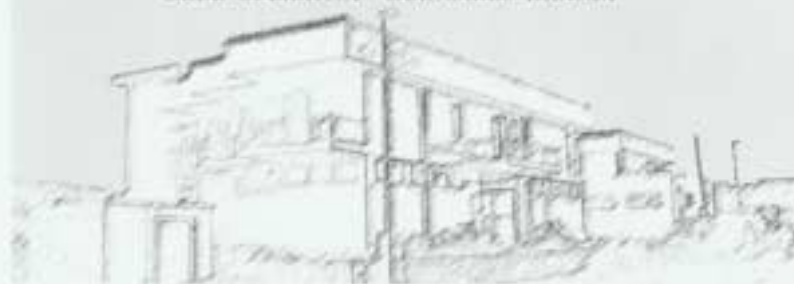
Comunità Terapeutica "Fratello Sole" SEDE OPERATIVA "GIANCARLO BRASCA"

Lazzati, a lanciare una raccolta di fondi che permise il successo dell'iniziativa. L'attività terapeutica per la cura dei giovani vittime della droga è oggi una realtà operativa e viene svolta da personale altamente qualificato nelle sedi di Gioia del Colle (Ba), Santa Severa (Rm), e la nuova comunità di Tolfa dove è stato appunto trasferito, ulteriormente potenziato, il Centro di Formazione Giancarlo Brasca.