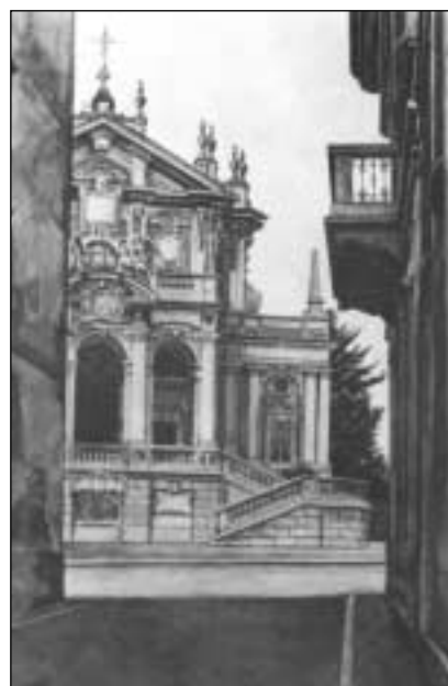
Chiesa lombarda - acquerello 35x50 (Berto Renzetti)