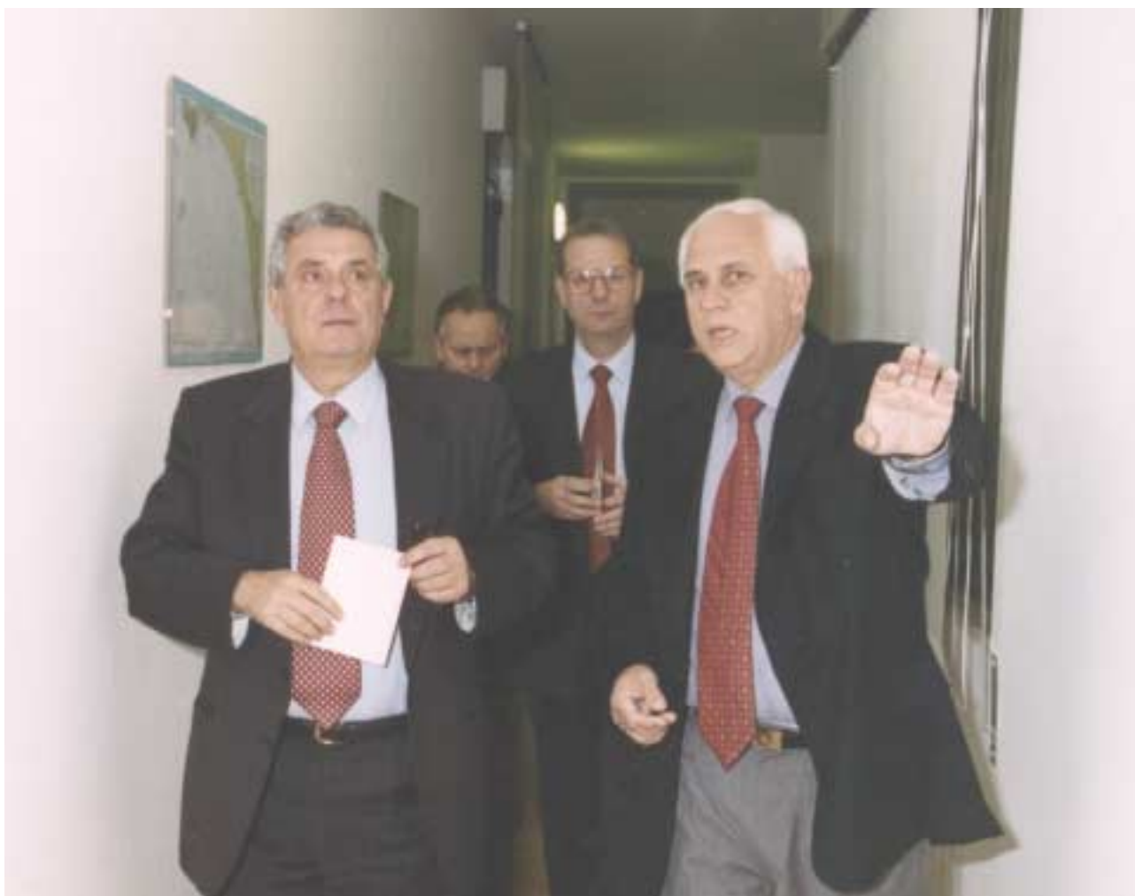
Il presidente della Cooperate illustra la struttura.