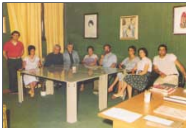
I primi operatori della Cooperate